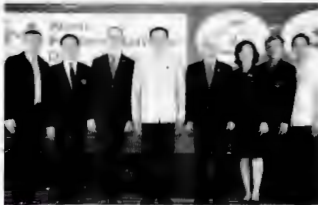
ปตท.ไทย - อยุธยา ขงฟู้วทูต มรว.ศราวุฒดุจ เบิดประจวบ "รับแห่งความปอดอดใจ ของสุ่ววโลก และรับแห่งความปอดอดใจของสุ่ววและนศบูกอกรศราวุฒดุจของ ประเทศไทย" มี พญ.พรเทพพิณ วิฟูอกร อธิบสีกรอนอนมี ร่วมด้วย ที่รร.มิวสิค